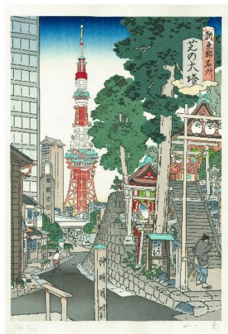
「新東都名所 芝の大塔」 山口晃