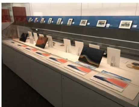
版木と摺り順序の展示