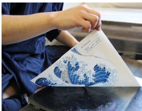
職人の木版技術により甦る 北斎「神奈川沖浪裏」