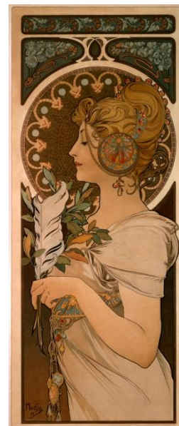
“羽根” OGATA コレクション

コレクターによるギャラリーツアーや「作品に隠された“HEART”を探せ！」等の楽しいイベントも予定しています！詳細はHPにてお知らせします。